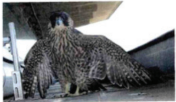
Falco pellegrino che ha nidificato in cima al Pirellone di Milano, ora affidato agli operatori dell'Enpa

In città come in natura vince chi riesce ad adattarsi. "Le gazze, ad esempio, hanno imparato a cibarsi dei nostri rifiuti e a non aver paura