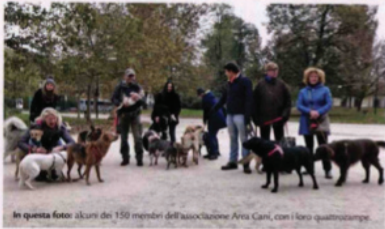
In questa foto: alcuni dei 150 membri dell'associazione Area Cani, con i loro quattro zampe.