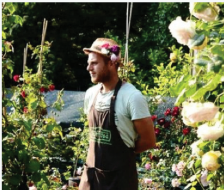
DAI BLOG (-17) Vigna urbana a Milano, la vigna di Leonardo da Vinci - Io e Orticola