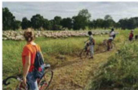
Città rurale Porto di Mare con il percorso per mountain bike e, sullo sfondo, un gregge di pecore

Nostra/CFU: cura dei boschi e del giardino d'acqua a Boscoincittà, pulizie e manutenzione dei sentieri a Porto di Mare, piantagioni alla cava Ongari www.cfu.it