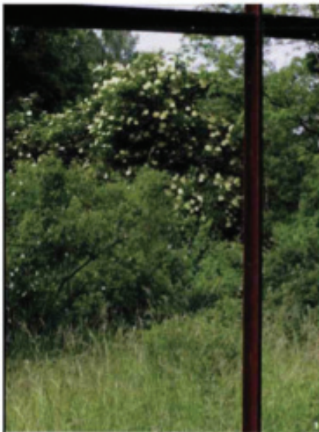
1. È maggio: le rose selvatiche sono in piena fioritura. 2. Uno dei sentieri del parco tedesco ottenuti riempiendo di terra i binari in disuso.