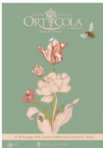
L'immagine dell'evento è di Sofia Paravicini

Il tema scelto per l'edizione 2019 ( 'Piante amiche: le buone associazioni botaniche' ) suggerisce di abbinare piante con le medesime necessità in termini idrici, di temperatura, di terreno, senza ovviamente tralasciare la componente estetica. La delicata immagine-simbolo dell'evento, firmata dall'artista Sofia Paravicini , non a caso raffigura due fiori in grado di vivere in armonia: una peonia e un tulipano , in cui convivono alcuni insetti fondamentali per l'ecosistema. Una delle tante novità dell'evento florovivaistico, presieduto da Gianluca Brivio Sforza , è che quest'anno, in occasione dei 500 anni dalla morte di Leonardo da Vinci , Orticola s'iscrive nella serie di iniziative dedicate al genio toscano con il progetto 'Orticola per Leonardo' : nel Cortile delle Armi del Castello Sforzesco sarà allestita la 'Pergola dei gelsi' , riproduzione in scala della gigantesca decorazione che Leonardo