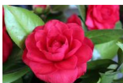
Camelie nel Parco delle Camelie di Locarno

Cascina Merlata - Milano, 17 e 18 marzo Festa di primavera con esposizione di esemplari di camelie divisi per appartenenza botanica e varietà provenienti da tutto il mondo; percorso didattico sull'origine, storia e coltivazione del genere camelia con approfondimenti sulla produzione di tè e di olio; visita guidata alla esposizione con il presidente della Società Italiana della Camelia e mostra mercato. www.cascina-merlata.net , www.lacamelaiodoro.com