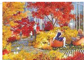
Autunno L'installazione Living Nature , dello studio Carlo Ratti Associati ricrea le quattro stagioni. Foto grande, AgrAir di Piurarch in piazza Castello per Inhabits