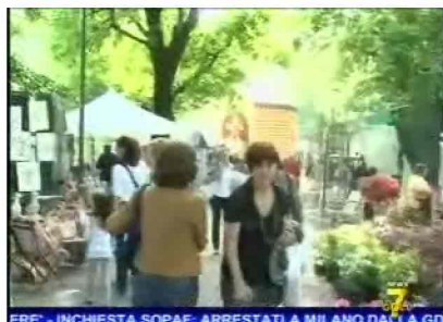
ERE' - INCHIESTA SOPAF: ARRESTATI A MILANO DALLA GDI