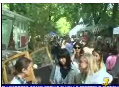
ELL'IMPORTO COMPLESSIVO E' NELLE EFFETTIVE DISPONIB