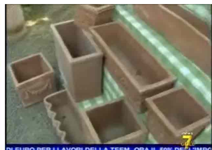
DI EURO PER I LAVORI DELLA TEAM, ORA IL 50% DELL'IMPC