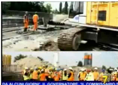
DA ALCUNI GIORNI, IL GOVERNATORE, 'IL COMMISSARIO S

Anche quest' anno piante fiori tanti coloratissimi affolleranno Orticola la mostra mercato in programma da oggi fino a domenica ai giardini Montanelli di Milano judo rosso esima edizione l' appuntamento giardini pubblici di Porta Venezia ormai una tradizione della primavera milanese in cui alla passione per il giardino si unisce anche un pizzico di eccentrica mondanità l' edizione 2014 avrà come tema portante la riscoperta della rosa italiana