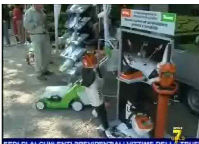
SEDI DI ALCUNI ENTI PREVIDENZIALI VITTIME DELLA TRUFF