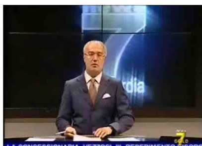
LA CONCESSIONARIA, VEZZOSI, 'IL REPERIMENTO RISORSI