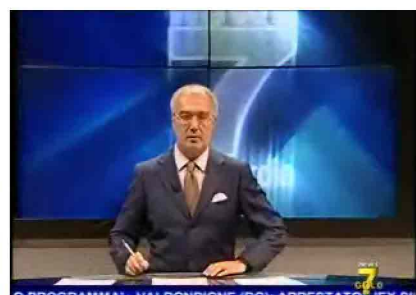
O PROGRAMMA' - VALBONDIONE (BG): ARRESTATO L'EX SI