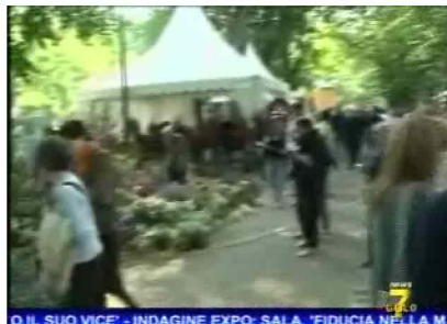
O IL SUO VICE' - INDAGINE EXPO: SALA, 'FIDUCIA NELLA M