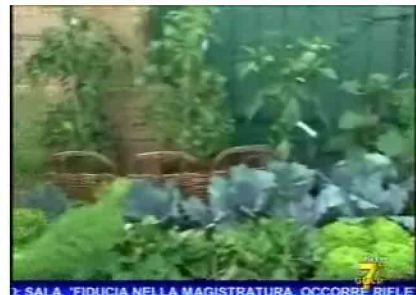
SALA, 'FIDUCIA NELLA MAGISTRATURA, OCCORRE RIFLE