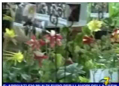
E: ARRIVATI 530 MLN DI EURO PER I LAVORI DELLA 'TEAM, I