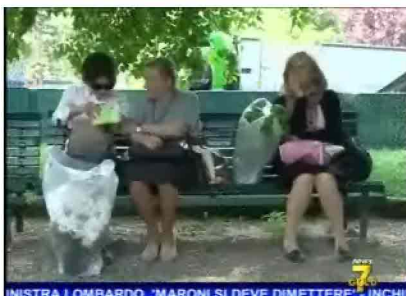
INISTRA LOMBARDO, 'MARONI SI DEVE DIMETTERE' - INCHI