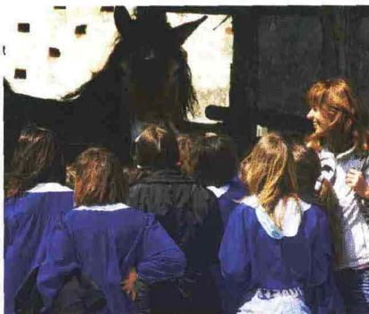
La 25ª «Mostra agrozootecnica - Ambiente e turismo», Mostra mercato con esposizione di bestiame da allevamento, piante aromatiche officinali e da giardino, si svolge a Massarosa (Lucca) sabato 17 e domenica 18 aprile