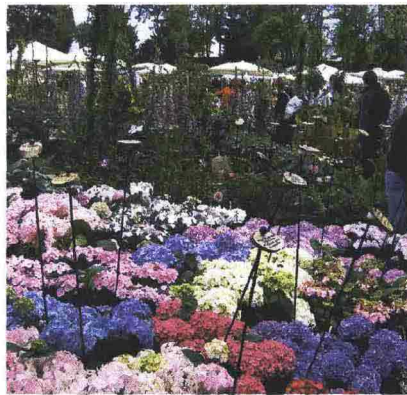
Uno scorcio della passata edizione di «Tre giorni per il giardino» di Caravino (Torino) che quest'anno si svolge dal 29 aprile al 2 maggio

Dal 29 aprile al 2 maggio si svolge la 19ª