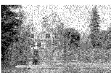
Villa Serra, Sant'Olcese (Genova), Per informazioni: tel. 010 715577, www.villaserra.it