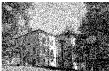
Villa La Pescigola, Fivizzano (Massa). Tel. 0585 927109, www.villapescigola.com