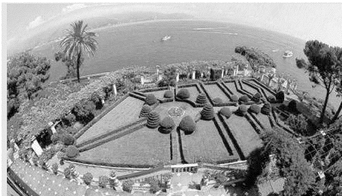
L'abbazia della Cervara a Santa Margherita Ligure