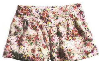
Fanno parte della Garden collection gli shorts di H&M (€ 19,95; www.hm.com ).

Rose e viole, primule e camelie: su abiti, sottovesti e accessori è tutta un'esplosione di colori e corolle