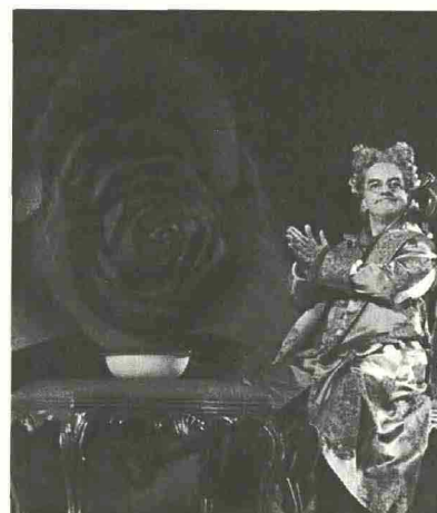
FESTIVAL DELLE ROSE Ciliverghe di Mazzano (BS), Musei Mazzucchelli dal 29 al 30 maggio

L'appuntamento con il fascino delicato delle rose di Monza è fissato per venerdì 21 maggio al Roseto "Niso Fumagalli" della Villa Reale di Monza. Proseguendo una tradizione di 47 anni, i Concorsi Internazionali per Rose Nuove sono diventati tra i più importanti al mondo. Sono indetti dall'Associazione Italiana della Rosa, fondata da Niso Fumagalli nel 1963 e oggi presieduta dal figlio Silvano. Per la prima volta, la premiazione dei Concorsi si terrà nei saloni d'onore della Villa Reale: il fasto e l'eleganza della Villa completeranno così la bellezza e il profumo delle rose. Quest'anno, le rose nuove in concorso sono 69, di cui 27 nella categoria delle Ibride di Tea e Grandiflora, 24 Floribunde, 8 Arbustive (Shrub). La maggior parte dei vivaisti è francese, infatti la Francia ha una grande tradizione nelle rose nuove e nelle vittorie ai Concorsi di Monza. Gli italiani sono cinque, confermando così la crescita nelle presenze registrata nell'ultimo triennio. Gli altri Paesi rappresentati sono Belgio, Danimarca, Germania, Gran Bretagna, Spagna, Svizzera. I Concorsi di Monza hanno da sempre affiancato alla rosa la presenza femminile e quest'anno, la madrina è Xian Zhang, giovane direttore musicale dell'Orchestra Sinfonica "Verdi" di Milano.