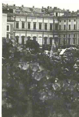
CONCORSI INTERNAZIONALI ROSE NUOVE Monza, Villa Reale venerdì 21 maggio

"Se vuoi essere felice tutta la vita diventa giardiniere" recita un proverbio cinese, se vuoi essere felice per un giorno vieni al Perugia Flower Show. Dal 21 al 23 maggio, ai Giardini del Frontone, torna la mostra mercato nazionale dedicata alle collezioni di piante rare ed inconsuete. Raggiunta dai più grandi nomi del florovivaismo nazionale, quest'anno la manifestazione raddoppia il numero degli espositori che proporranno al pubblico una variegata selezione di collezioni antiche e storiche, da quelle più tradizionali a quelle più singolari. Oltre ai vivai produttori e collezionisti, il Perugia Flower Show ospiterà espositori legati al mondo dell'arredamento da esterno, editoria specializzata e architettura del paesaggio. Infine, l'esposizione permetterà ad un pubblico specializzato e ai semplici amatori di dedicarsi o avvicinarsi alla cultura del verde, non solo visitando l'esposizione, ma anche partecipando ad appuntamenti organizzati dal Garden Club Perugia prenotando il proprio corso gratuito sul sito www.perugiaflowershow.com . La mostra sarà aperta venerdì 21 dalle ore 11.30 alle 20.00 mentre sabato 22 e domenica 23 dalle ore 10.00 alle 20.00.