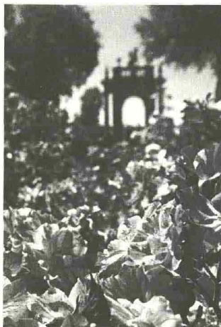
PERUGIA FLOWERS SHOW Perugia, Giardini del Frontone Borgo XX Giugno Dal 21 al 23 maggio

"Se vuoi essere felice tutta la vita diventa giardiniere" recita un proverbio cinese, se vuoi essere felice per un giorno vieni al Perugia Flower Show. Dal 21 al 23 maggio, ai Giardini del Frontone, torna la mostra mercato nazionale dedicata alle collezioni di piante rare ed inconsuete. Raggiunta dai più grandi nomi del florovivaismo nazionale, quest'anno la manifestazione raddoppia il numero degli espositori che proporranno al pubblico una variegata selezione di collezioni antiche e storiche, da quelle più tradizionali a quelle più singolari. Oltre ai vivai produttori e collezionisti, il Perugia Flower Show ospiterà espositori legati al mondo dell'arredamento da esterno, editoria specializzata e architettura del paesaggio. Infine, l'esposizione permetterà ad un pubblico specializzato e ai semplici amatori di dedicarsi o avvicinarsi alla cultura del verde, non solo visitando l'esposizione, ma anche partecipando ad appuntamenti organizzati dal Garden Club Perugia prenotando il proprio corso gratuito sul sito www.perugiaflowershow.com . La mostra sarà aperta venerdì 21 dalle ore 11.30 alle 20.00 mentre sabato 22 e domenica 23 dalle ore 10.00 alle 20.00.